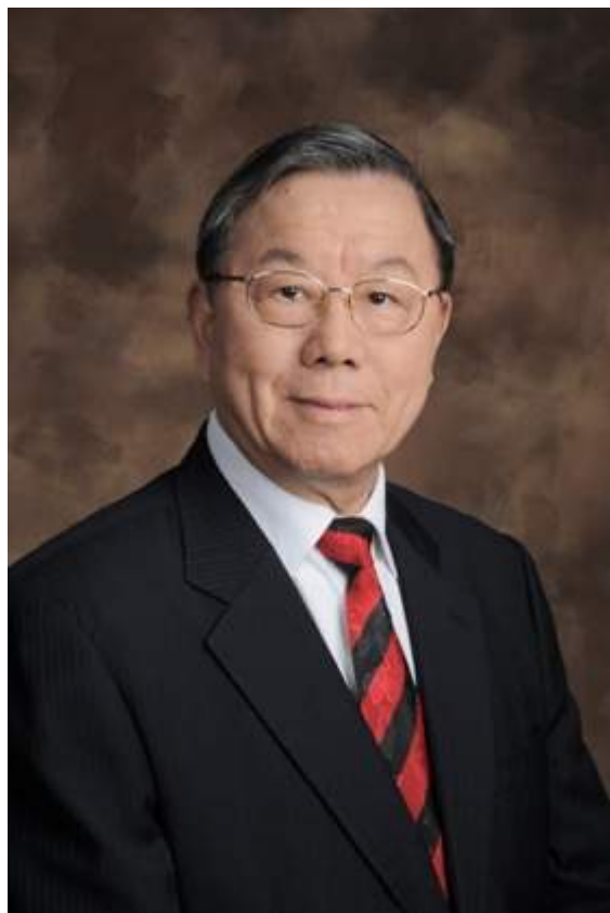
施杞 国医大师 终身教授、博导